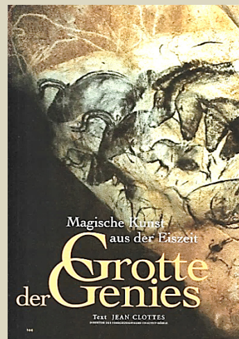
National Geographic-Heft 8/2001

Die Entdeckung der einzigartigen Grotte Chauvet im Jahr 1994 löste großes Erstaunen aus. Bis 36 000 Jahre vor unserer Zeit lassen sich die mehrfarbigen Wandgemälde dieser Höhle zurückdatieren. Sie zeigen vollendete Vielgestaltigkeit und Ausdruckskraft bereits in den frühesten magischen Bild-Erzählungen unserer VorfahrInnen. Die bisherigen Vorstellungen über die Entstehung von Kunst mussten revidiert werden.